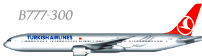
Схема салона Boeing 777-300 Seating plan